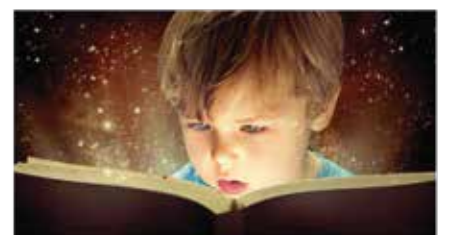
Diplomatura en Literatura Infantil para Docentes