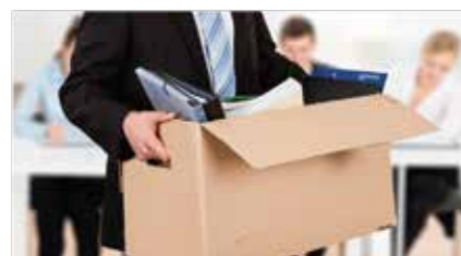
Diplomatura en Causales de Extinción de Contratos de Trabajo