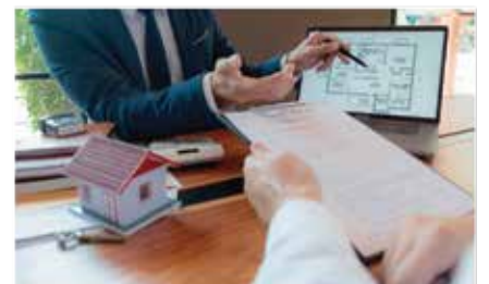
Curso Nuevas Formas de Contratación Inmobiliaria