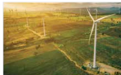
Seminario sobre Economía de los Recursos Naturales y el Medioambiente